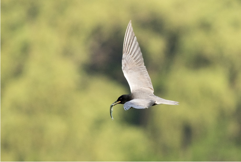
Guifette noire