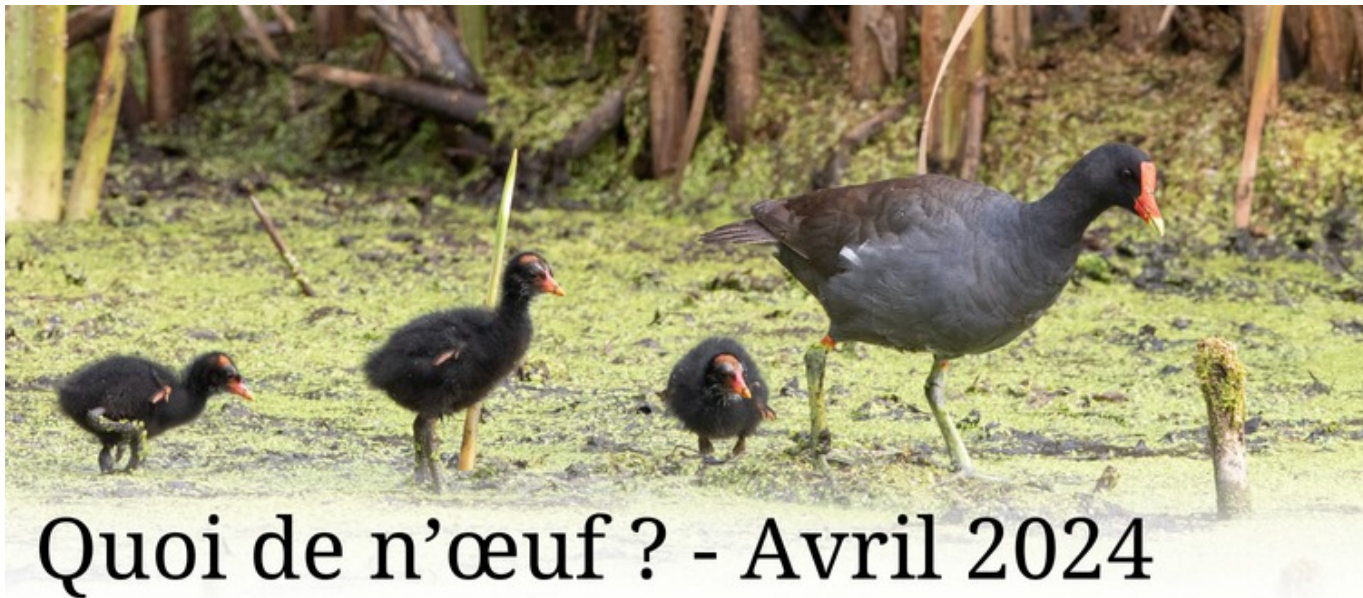
Gallinule d'Amérique