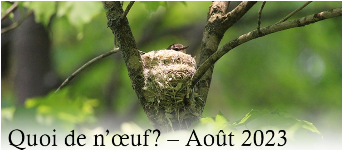
Paruline flamboyante