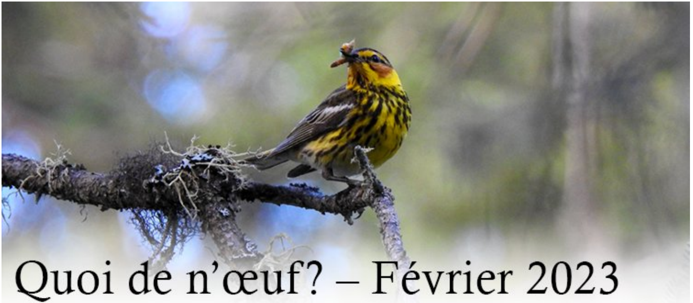
Paruline tigrée